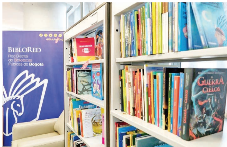
Este espacio alternativo de lectura, especializado en temas de género y sexualidad, cuenta con títulos de obras clásicas y de literatura incluyente.

BiblioRed, por brindar nuevos espacios alternativos para la lectura y la diversidad que promuevan la política pública LGBTI de bienestar y cuidado para todos y todas.