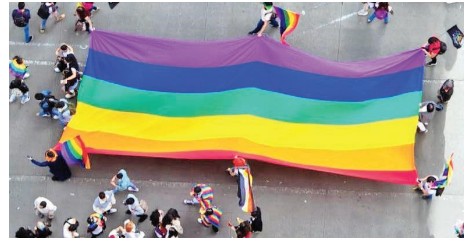
“Las personas homosexuales, bisexuales, trans, no binarias, queer, tenemos derecho a existir y a ser felices...”.

¿Qué entidades apoyan esta labor, y quienes se atraviesan? Generalmente, tenemos muchos apoyos. En todas nuestras casas tenemos punto de atención en salud con la Secretaría de salud; en tres de nuestras casas tenemos