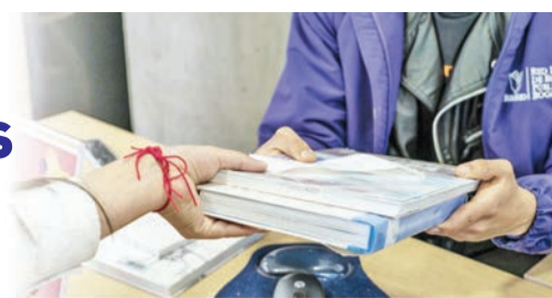
Recuerde que puede dirigirse a la biblioteca más cercana para hacer la entrega a nuestros funcionarios del material solicitado en préstamo.

Es hora de que los libros vuelvan a su casa: ¡las bibliotecas! Los libros de nuestras bibliotecas son de todos y para todos, vamos a darnos la oportunidad de