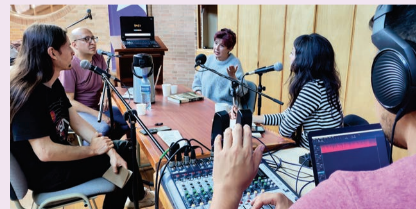
La emisión de LEO Radio se realiza en vivo de forma digital a través de www.biblired.gov.co