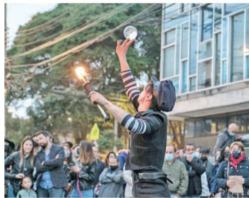
Equilibristas, músicos, bailarines, mimos y gran variedad de artistas más, los encontrará en el Distrito Diverso y Creativo La Playa.

“La historiografía universal ha sido un poco ingrata con la comunidad LGBTIQ+. Se habla de grandes personajes como Platón, Miguel Ángel o Da Vinci, pero nunca dicen que eran personas sexualmente diversas. O, por ejemplo, mujeres en Colombia, como la artista Débora Arango. Así que este museo recopila la historia de grandes personas de la historia de la comunidad que han enaltecido nuestra condición”, cuenta el activista.