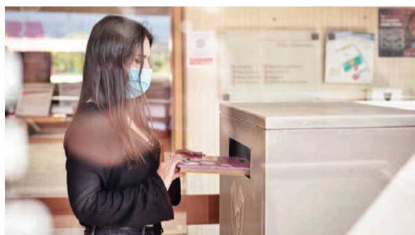
Si ya disfrutó de los materiales que llevó en préstamo, le invitamos a retornarlos a las bibliotecas para que puedan descansar y prepararse para llenar de alegría y experiencias a nuevos usuarios. 1