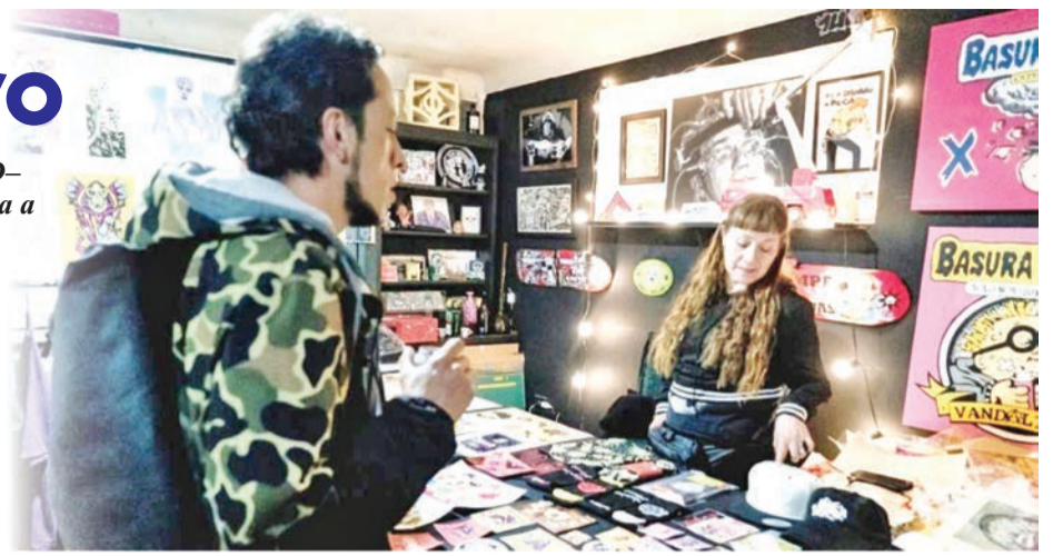
Capital Creativo es una iniciativa que busca beneficiar al sector cultural y creativo de la ciudad.

Capital Creativo es la oportunidad para que micro, pequeñas y medianas empresas (pymes) puedan acceder de manera fácil y ágil a una línea de crédito que les permitirá aportar a la economía del sector cultural y creativo.