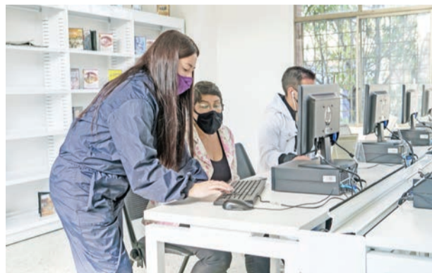
Les invitamos a que conozcan las diferentes opciones de afiliación, renovación, servicios a domicilio, etc.

Cada año deberá renovar su afiliación comunicándose a la línea 580 30 50 o acercándose a su Biblioteca más cercana. La renovación le permitirá poder acceder a los servicios de préstamo externo de nuestros recur-