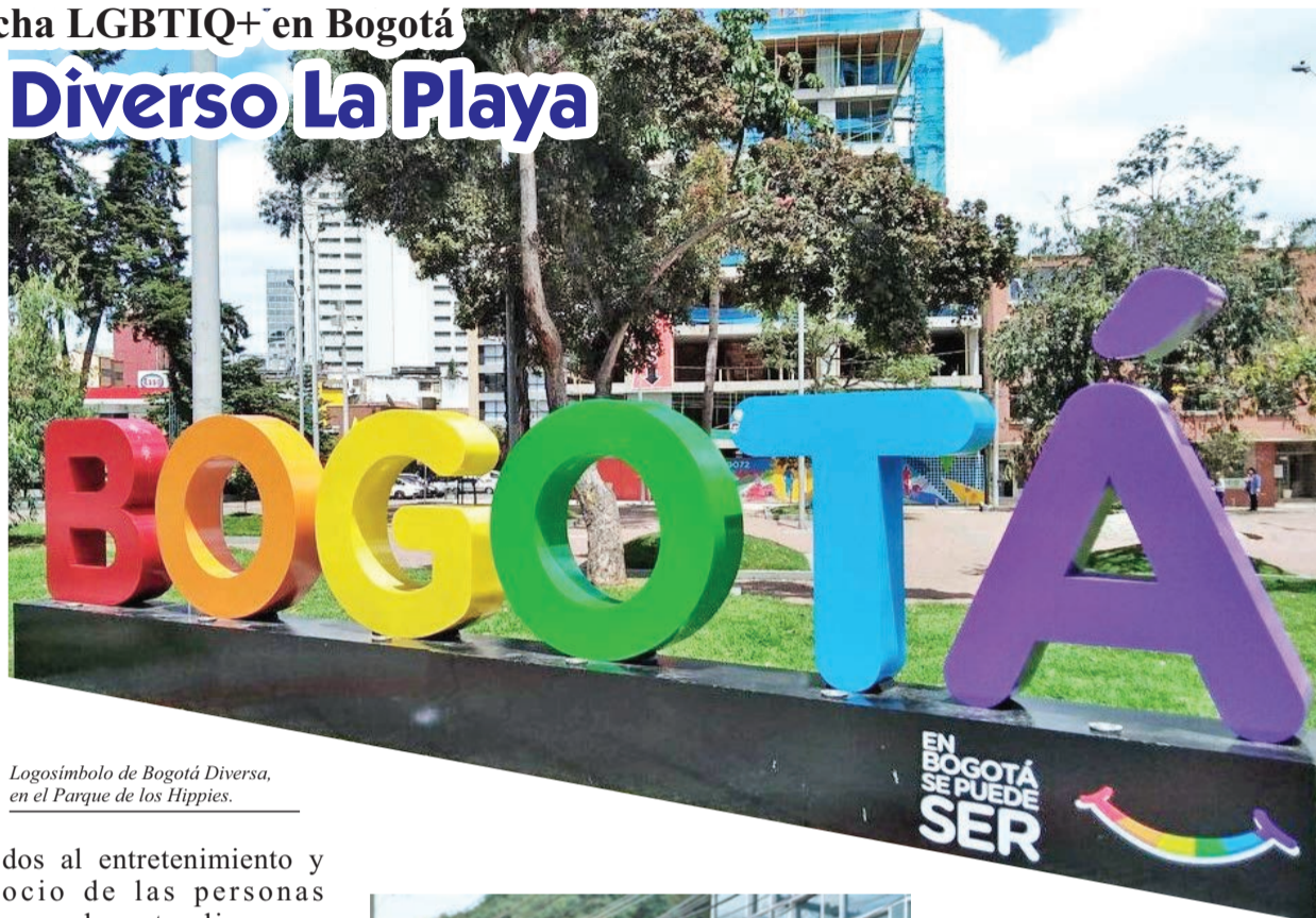
Logosímbolo de Bogotá Diversa, en el Parque de los Hippias.