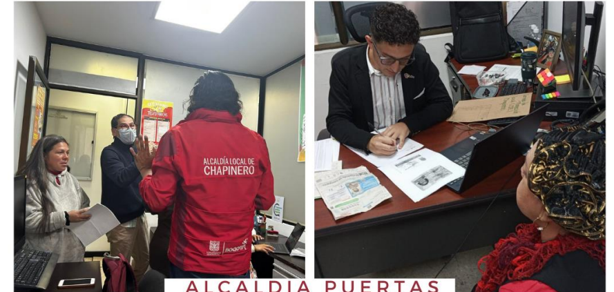
ALCALDIA PUERTAS ABIERTAS